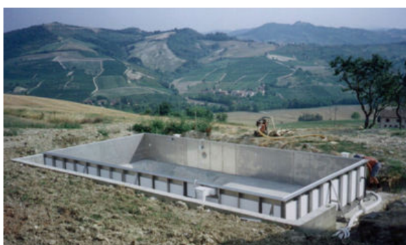
Vista d'insieme della struttura