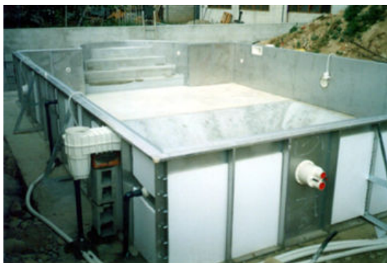
Struttura montata e accessori